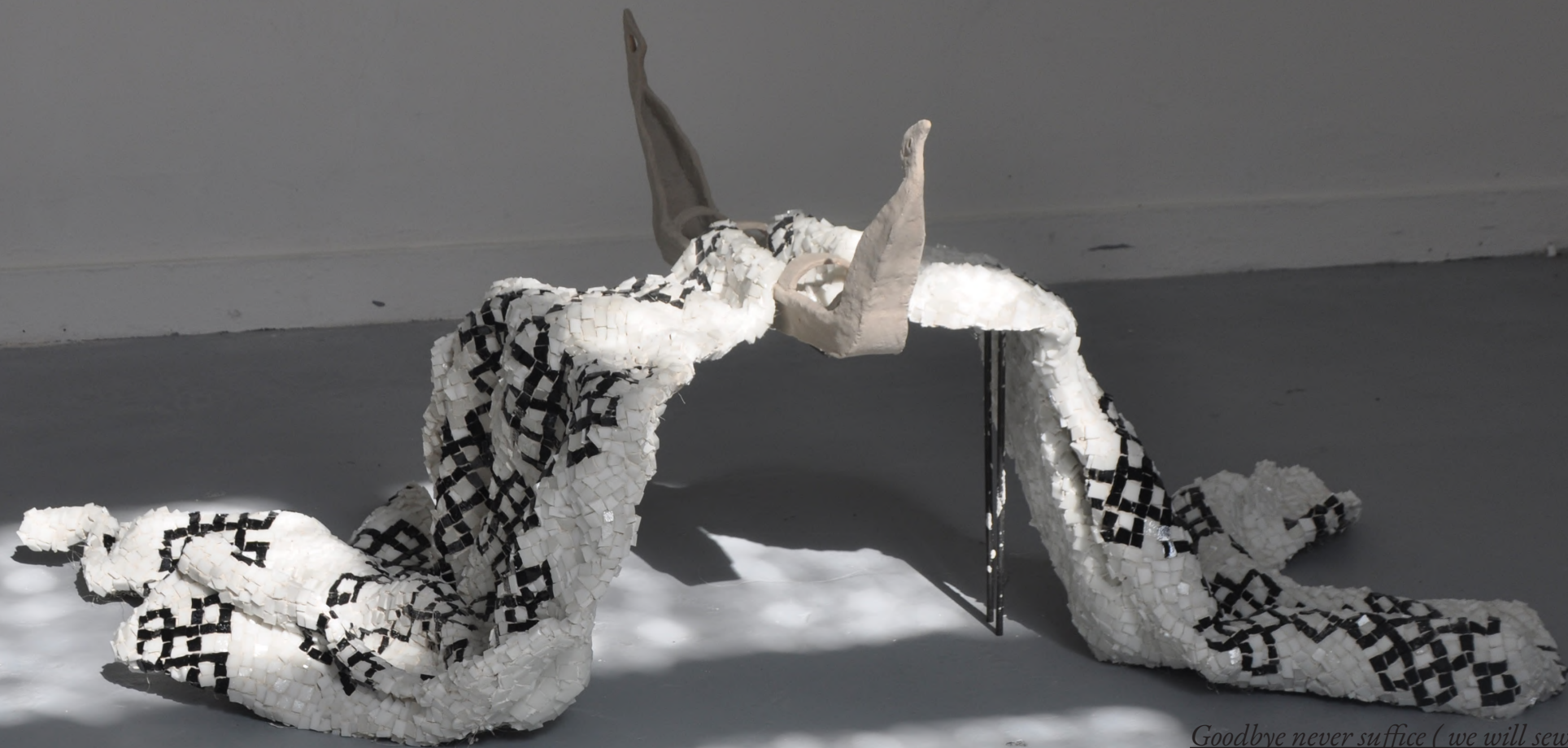
Goodbye never suffice ( we will sew a legend )

ceramique, sable, métal, grillage, filasse 110 × 55 × 50cm 2025