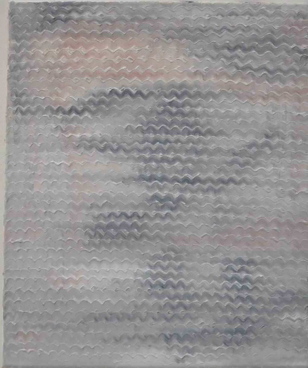
Sans titre l'huile sur toile 55*40cm 2025