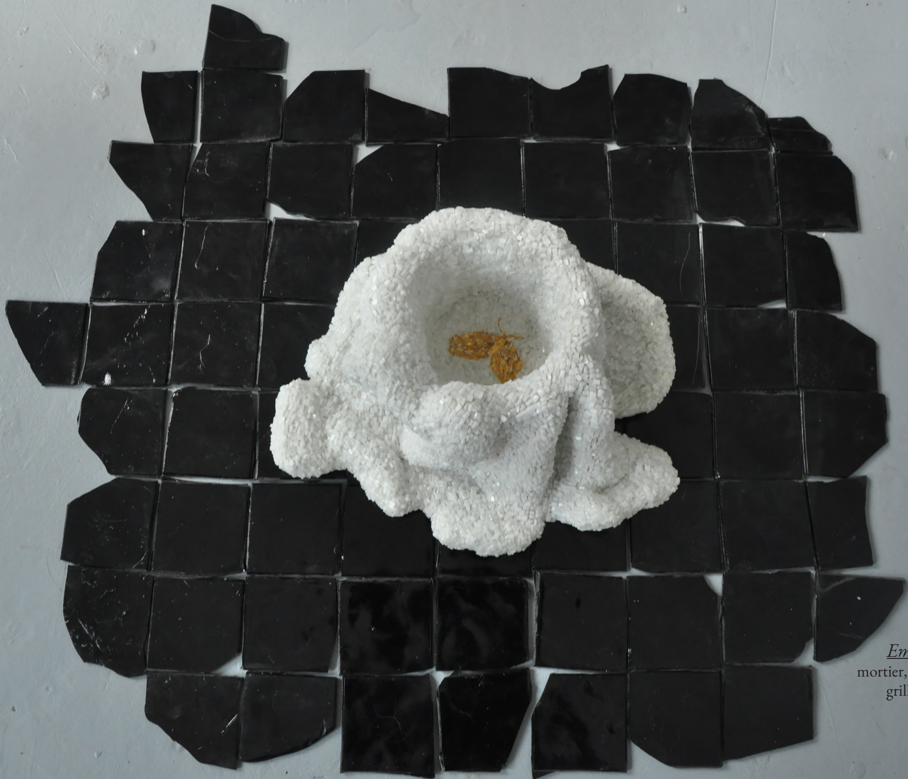
Embalmed memory mortier, verre, miroir dorée, grille métallique, filasse 15*25*25cm 2025