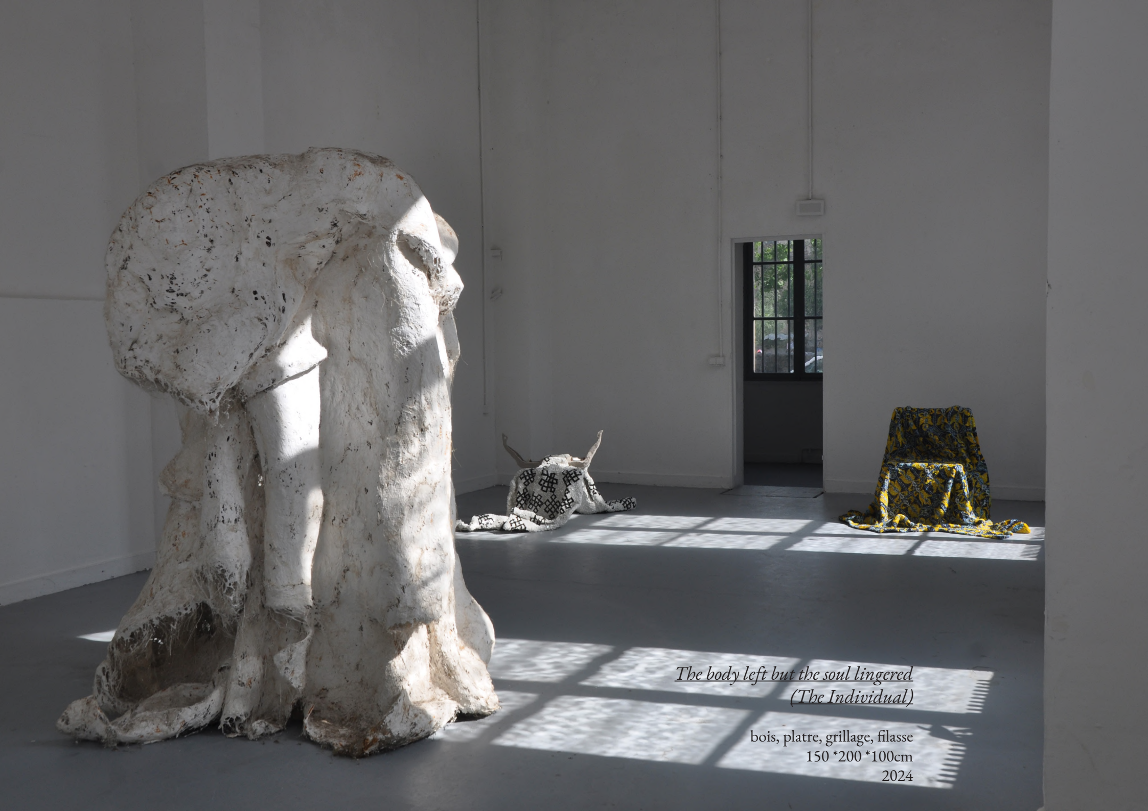
The body left but the soul lingered (The Individual)

bois, platre, grillage, filasse 150 *200 *100cm 2024