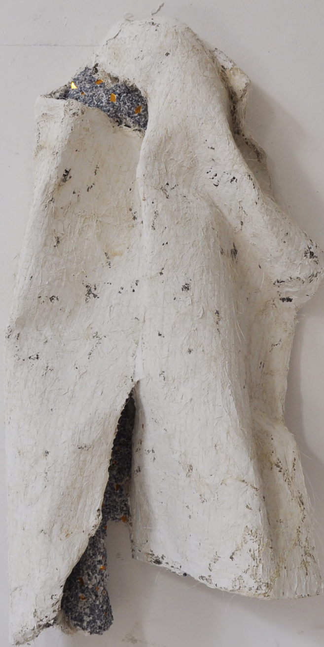
A veil of remembrance (series)

mortier, pierre, miroir dorée, grille métallique, filasse 115*66*30cm 2025