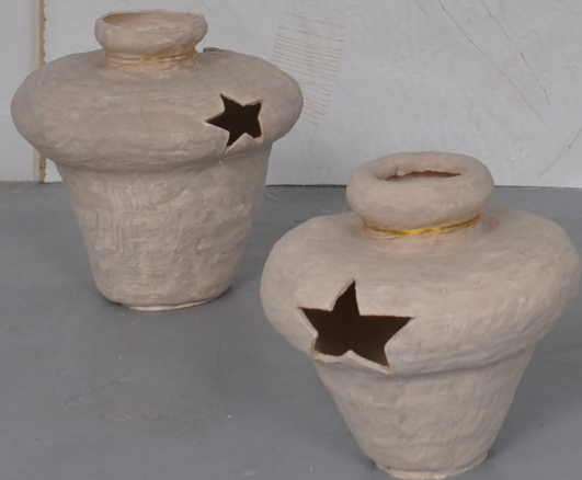
A veil of remembrance (series)

ceramique, sable, fil dorée, toile coton, fusain, peinture à l'huile 150*200cm 2025