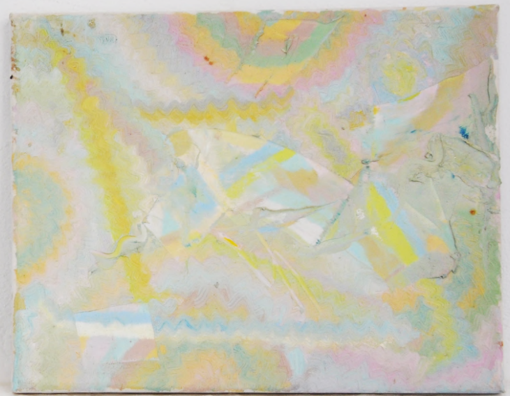
Sans titre l'huile sur toile 25 × 30cm 2024