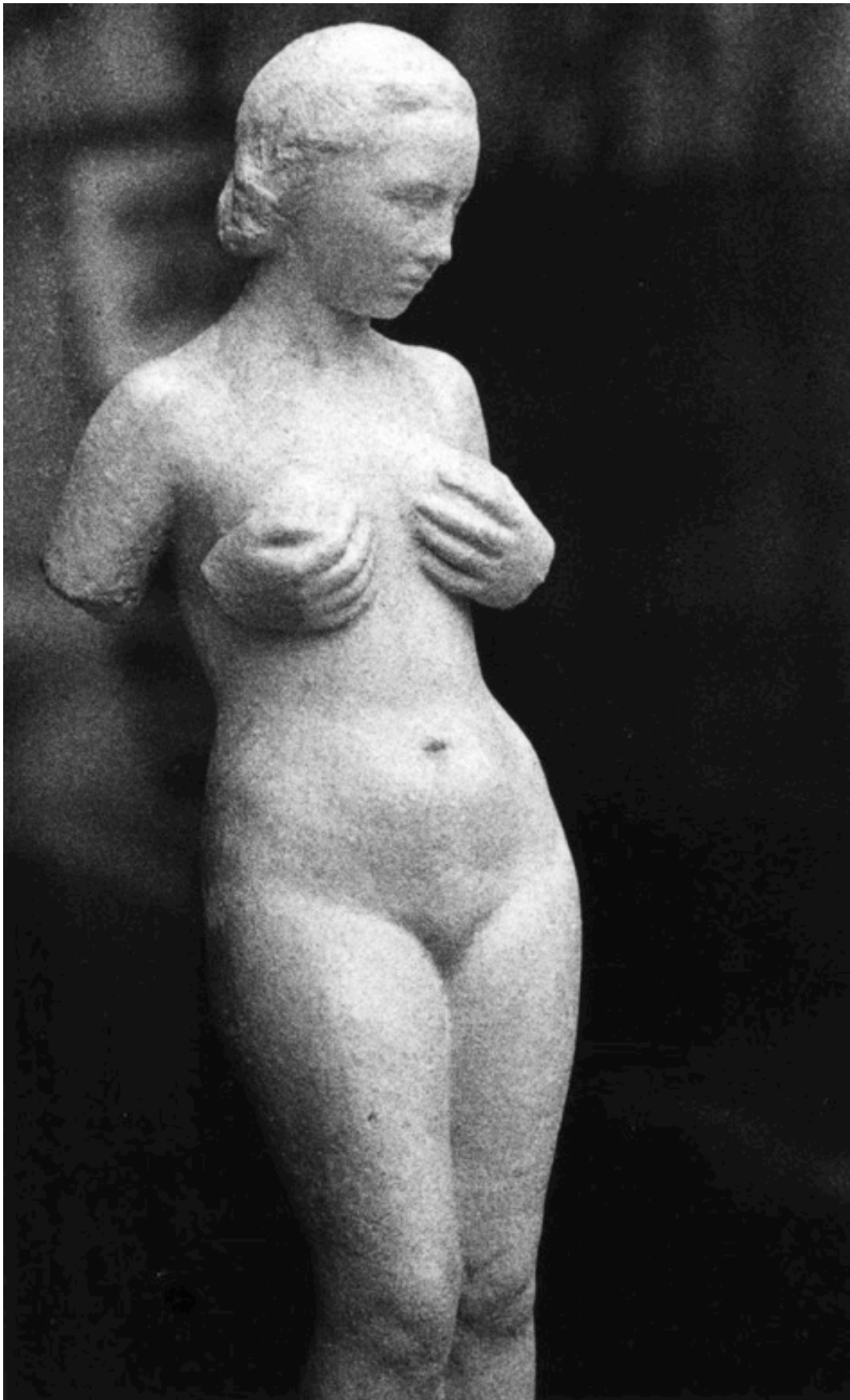
Philippe TARABELLA "La femme sans bras", 2006 1/10, 40x30 cm, tirage argentique sur papier baryté// 900 euros