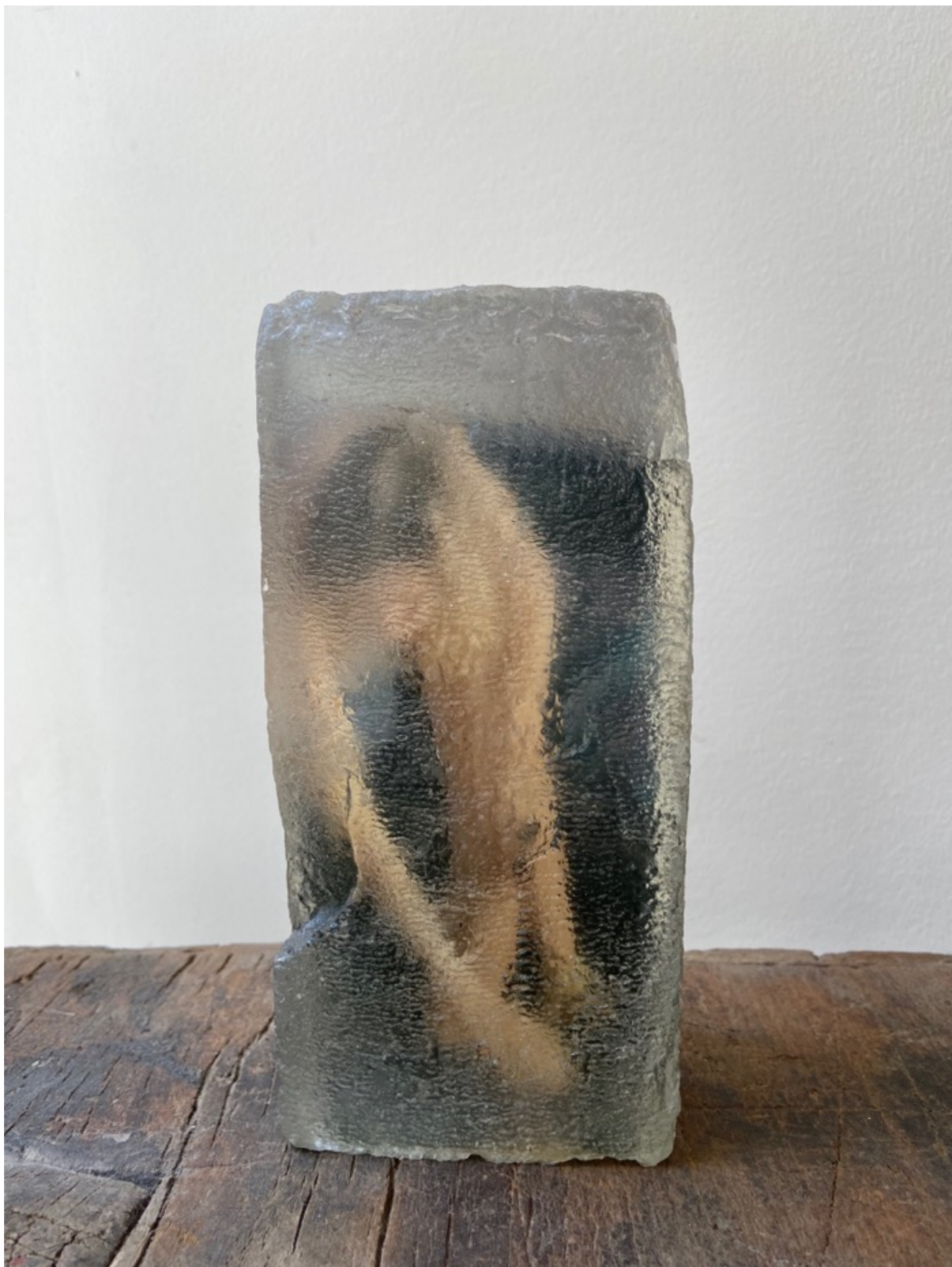
Ilan WEISS « Sans titre », 2020 20x10x8 cm, tirage jet d'encre, epoxy, objet photographique // 900 euros