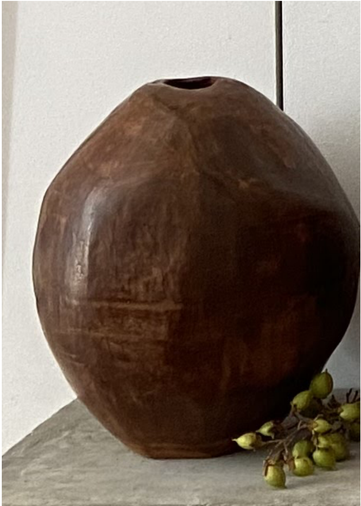
Maria KOLOSOVSKAYA "Stone", 2019 argile, cuisson au lait, cire d'abeille // 33 cm L X 38 cm H // 1200 euros