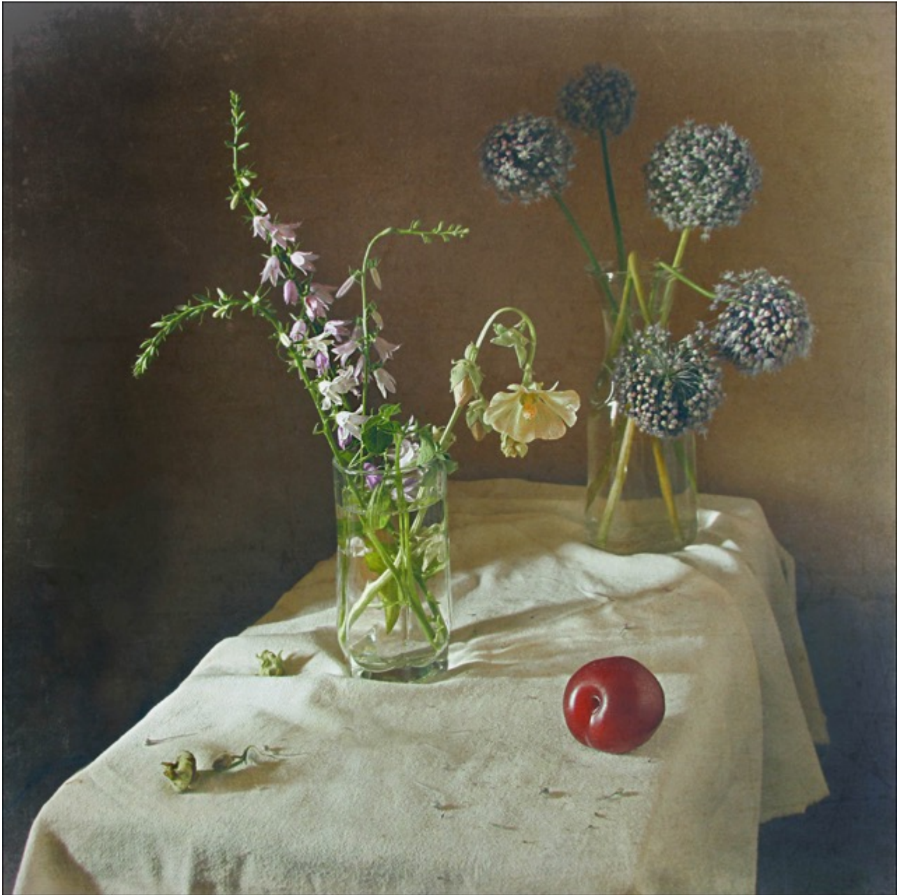
Galien CHIRIKOVA « Prune solitaire », 2013 1/8, 35x35 cm, tirage Lambda // 650 euros