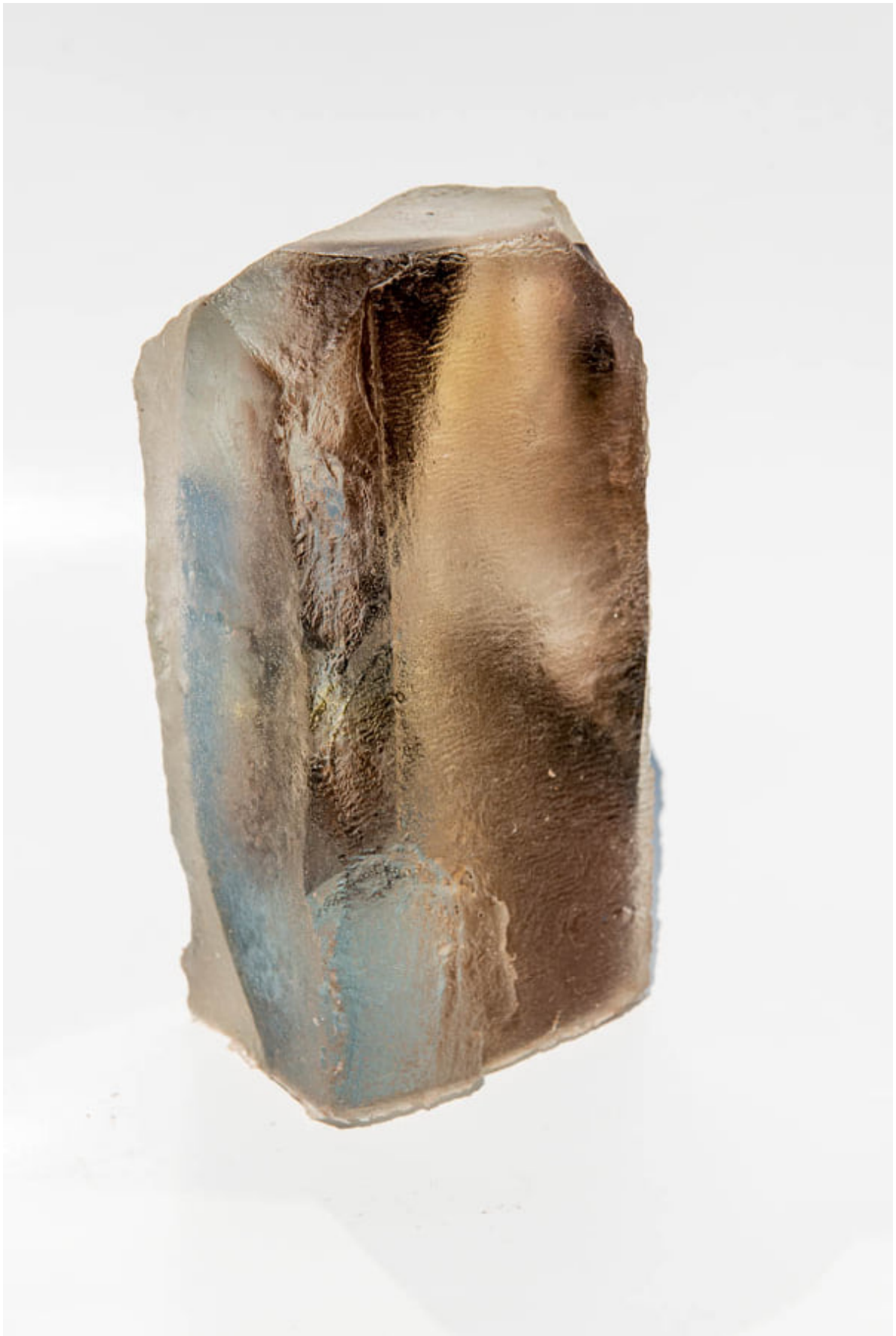
Ilan WEISS « Sans titre », 2020 20x10x8 cm, tirage jet d'encre, epoxy, objet photographique // 900 euros