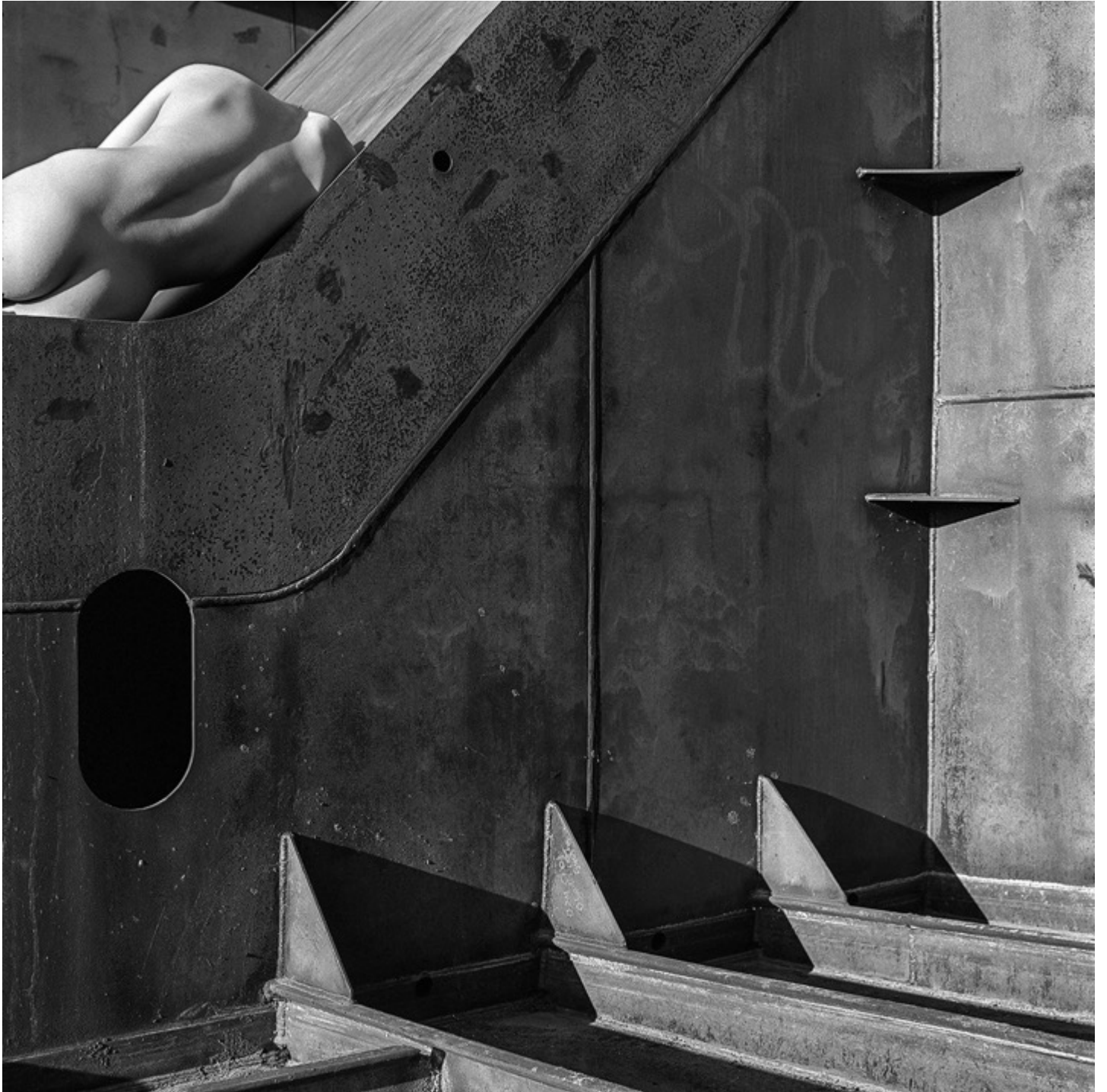
Evgeny MOKHOREV « Dos. Fort Constantin », 2006 2/20, 40x40 cm, tirage argentique // 2500 euros