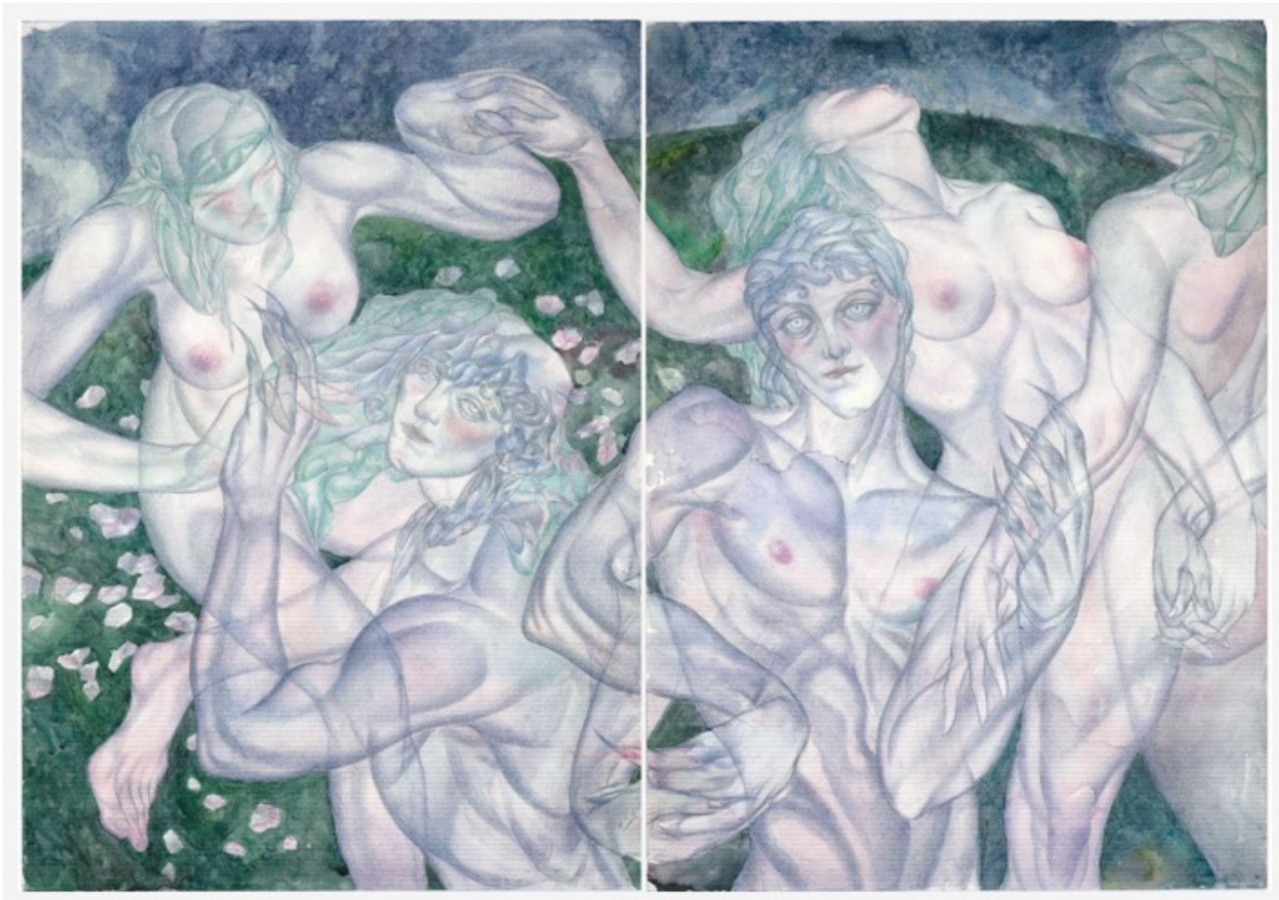
Svetlana EFREMOVA "Twins", 2021 80x120 cm, aquarelle et crayon sur papier // 3500 euros