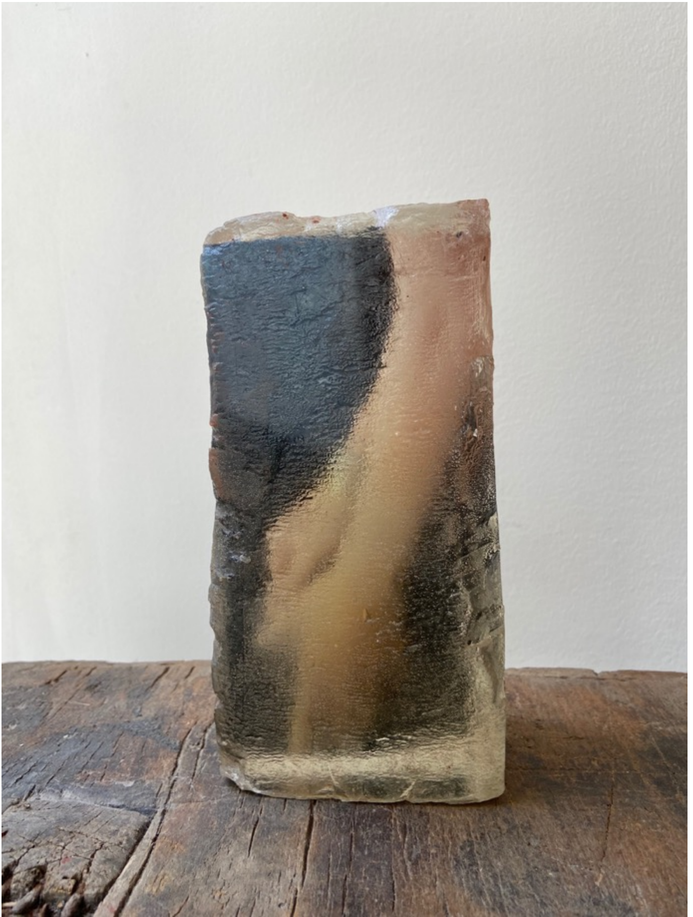
Ilan WEISS « Sans titre », 2020 20x10x8 cm, tirage jet d'encre, epoxy, objet photographique // 900 euros