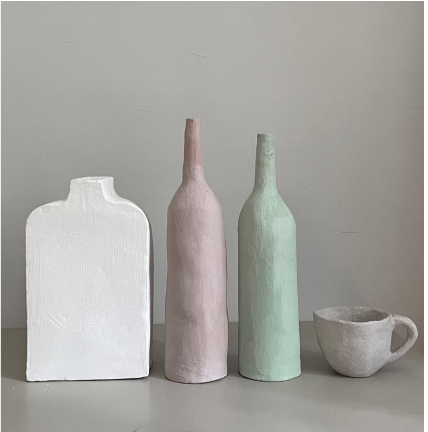
Mona ERMISHINA « Sans titre », 2022 4 pièces, terra cotta // 1600 euros