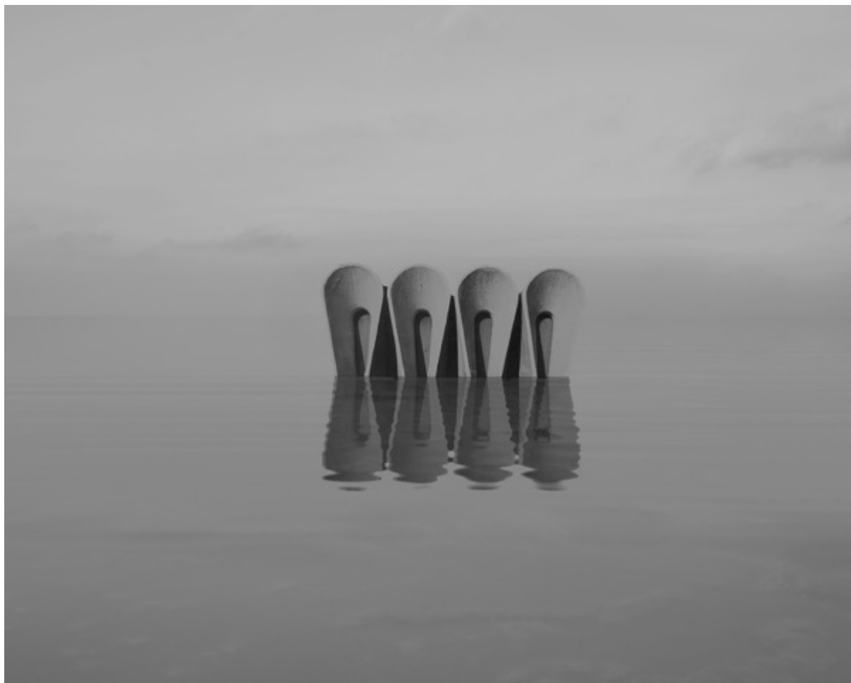
Danila TKACHENKO « Clôture, Arménie », 2021 2/12, 24x30 cm, tirage jet d'encre // 1200 euros