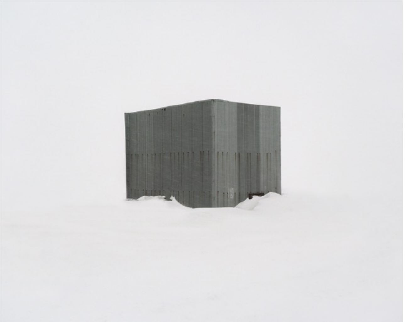
Danila TKACHENKO « Sarcophage recouvrant un puit de forage de quatre kilomètres de profondeur, aujourd'hui condamné », 2013 12/12, 40 x 50 cm, tirage jet d'encre // 7000 euros