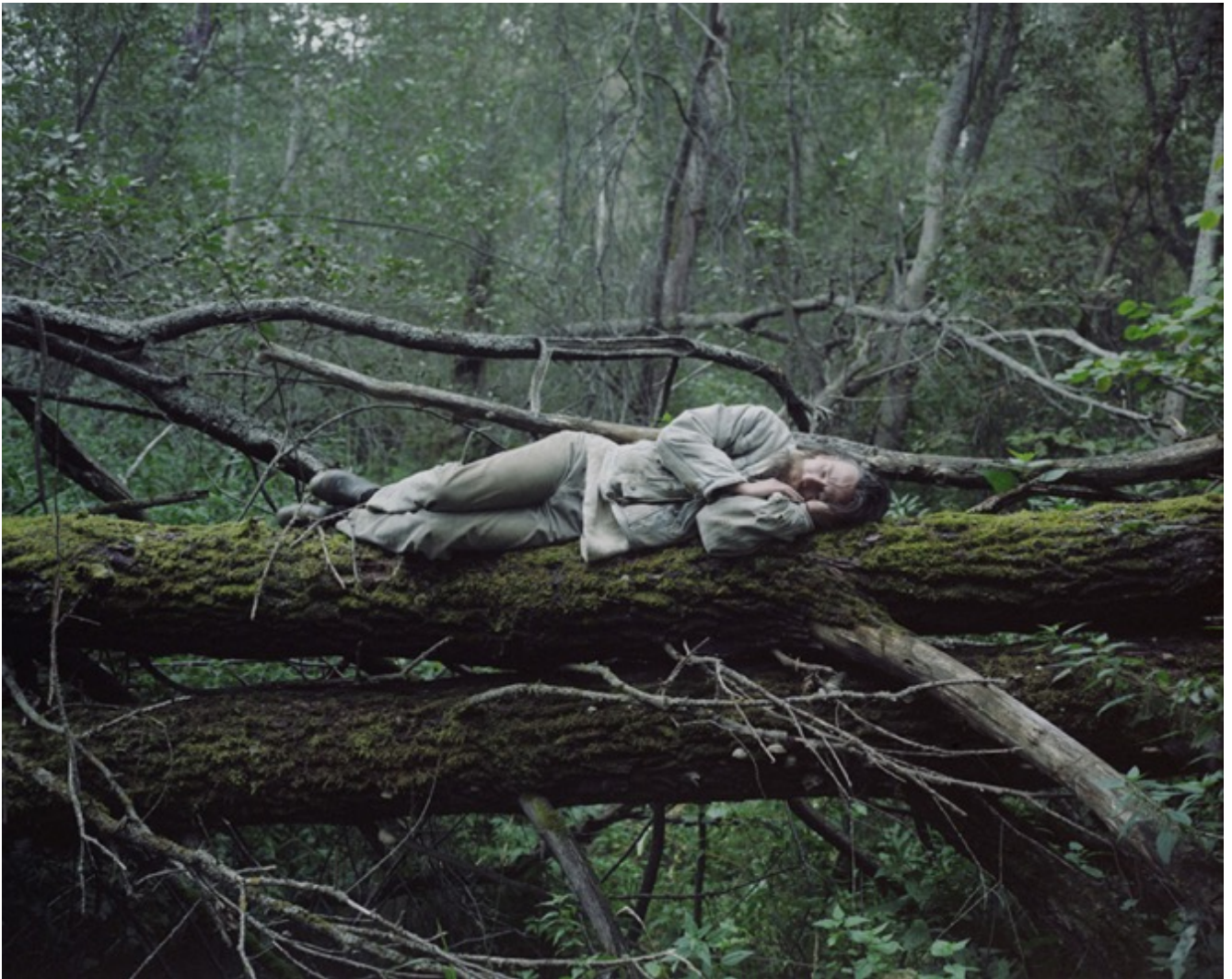
Danila TKACHENKO «« Sans titre », de la série « Escape », 2013, 2/12, 40 x 50 cm, tirage jet d'encre // 1000 euros