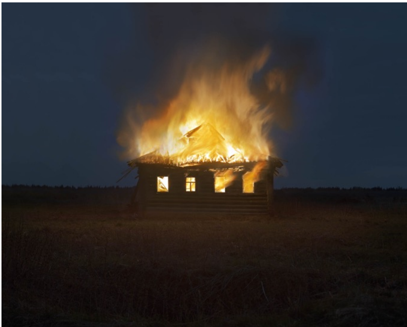
Danila TKACHENKO «#4 » de la série « Motherland », 2017 1/12, 50x62,5 cm, tirage jet d'encre // 2400 euros