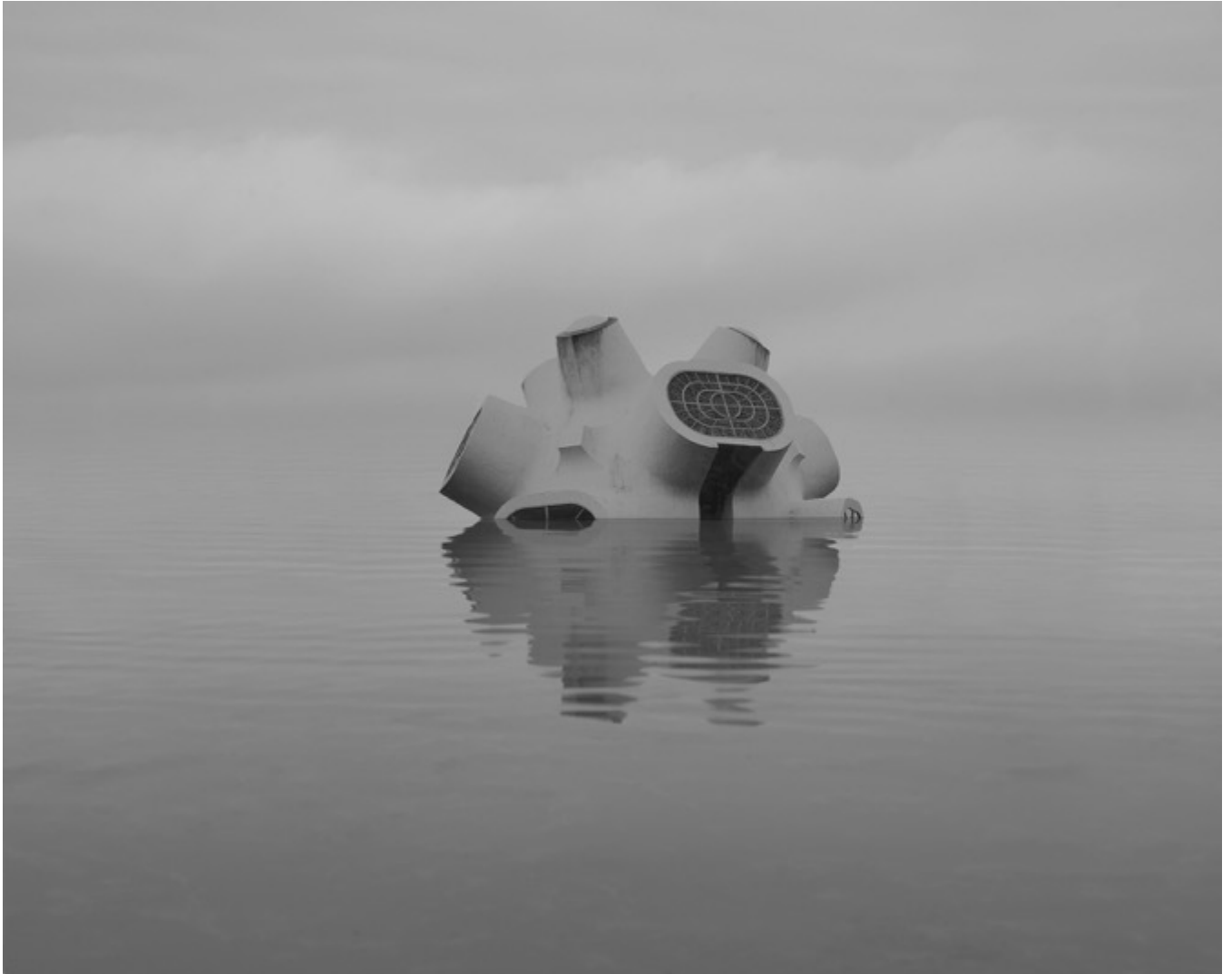
Danila TKACHENKO « Musée, Macédoine », 2021 1/12, 24x30 cm, tirage jet d'encre // 1200 euros