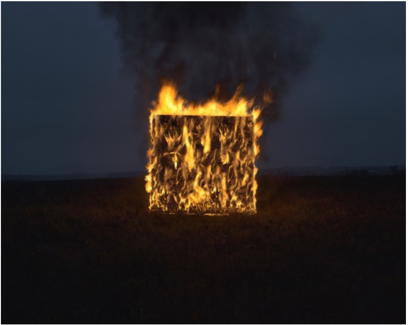
Danila TKACHENKO «#2» de la série « Motherland », 2017 4/12, 50x62,5 cm, tirage jet d'encre // 2700 euros