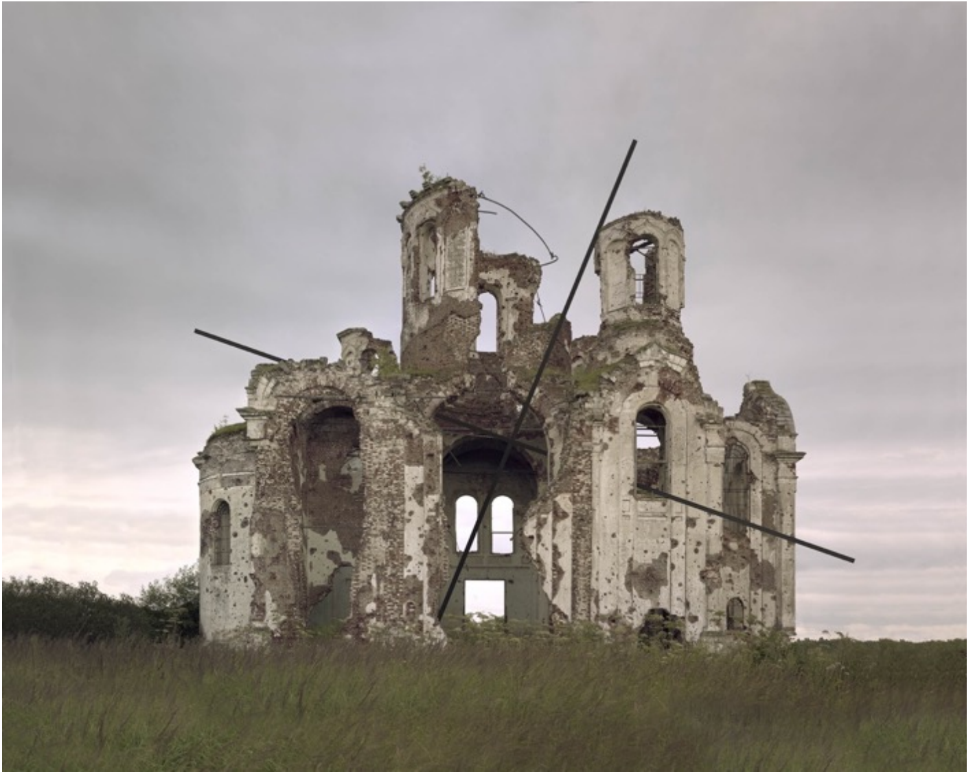
Danila TKACHENKO « #5» de la série « Monuments », 2017 3/7, 60x75 cm, tirage jet d'encre // 3400 euros