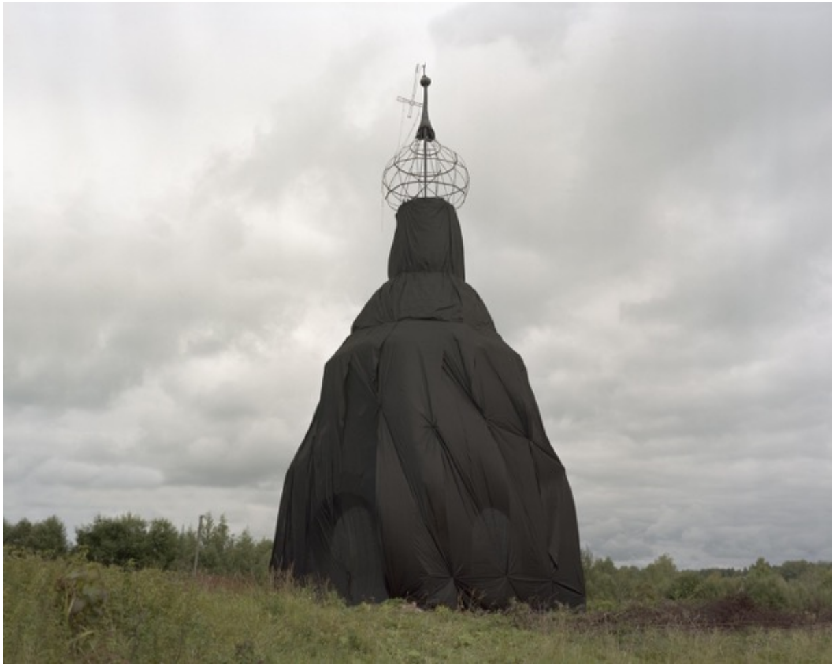
Danila Tkachenko « #7 » de la série « Monuments », 2017 2/7, 60 x 75cm, tirage jet d'encre // 3000 euros