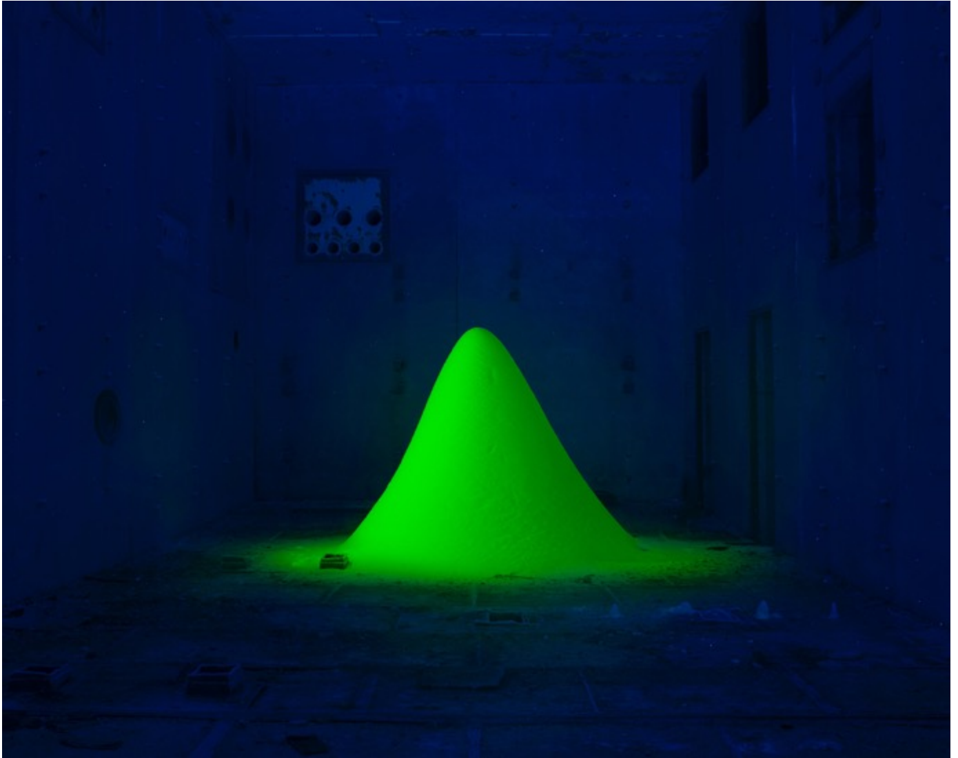
Danila TKACHENKO « Stalagmite dans une centrale nucléaire, Ukraine » 3/7, 72x90 cm, tirage jet d'encre // 2900 euros