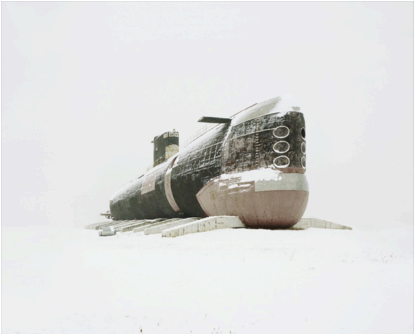
Danila TKACHENKO « Le plus gros sous-marin diesel du monde », 2013 11/12, 40 x 50 cm, tirage jet d'encre // 10 000 euros