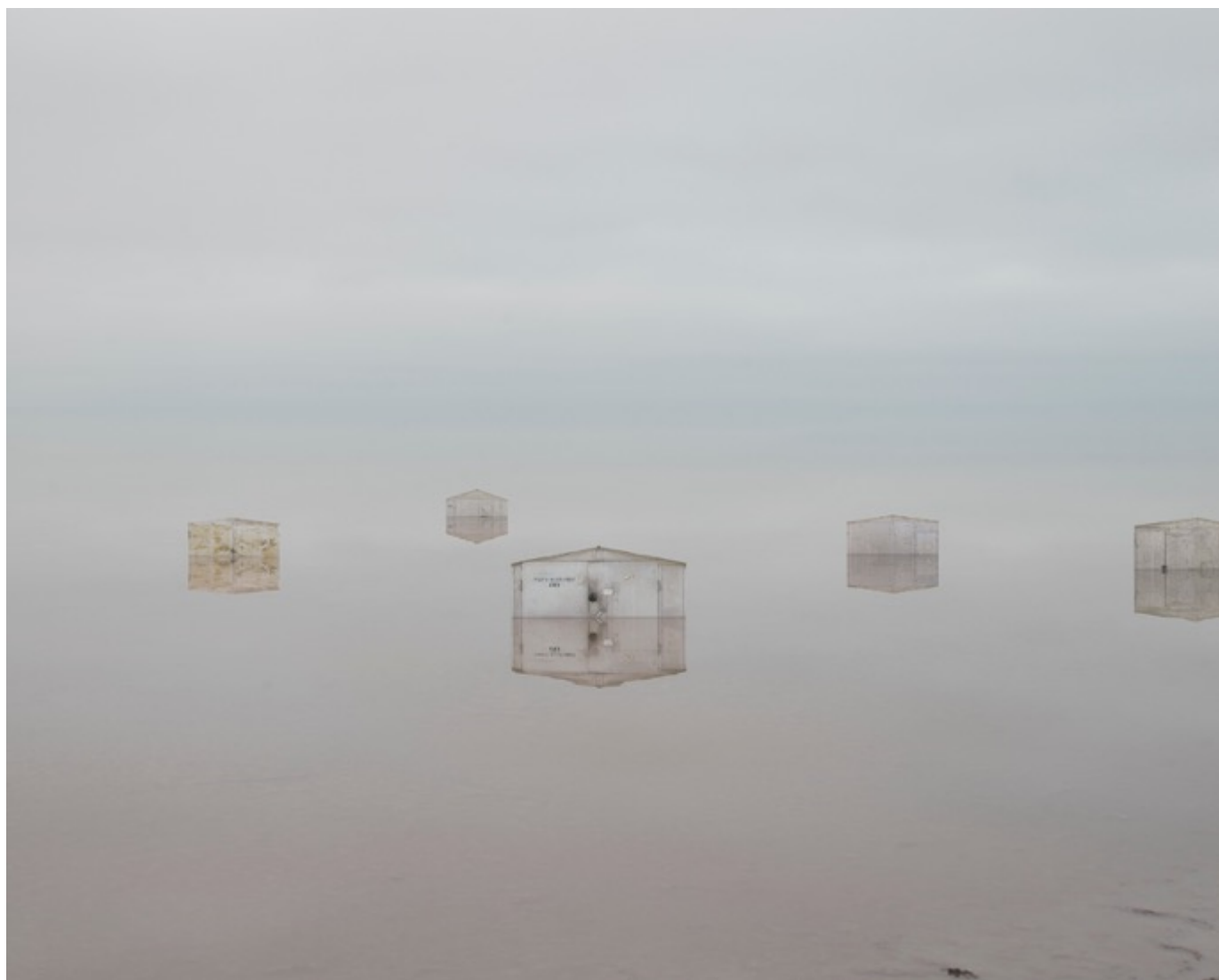
Danila TKACHENKO « Garages », 2021 2/10, 50x62,5 cm, tirage jet d'encre // 1800 euros