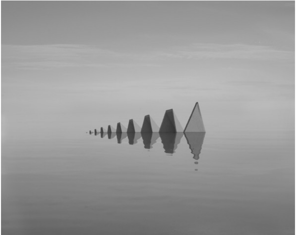
Danila TKACHENKO « Façade d'une station de métro, Hongrie », 2021 2/12, 24x30 cm, tirage jet d'encre // 1200 euros