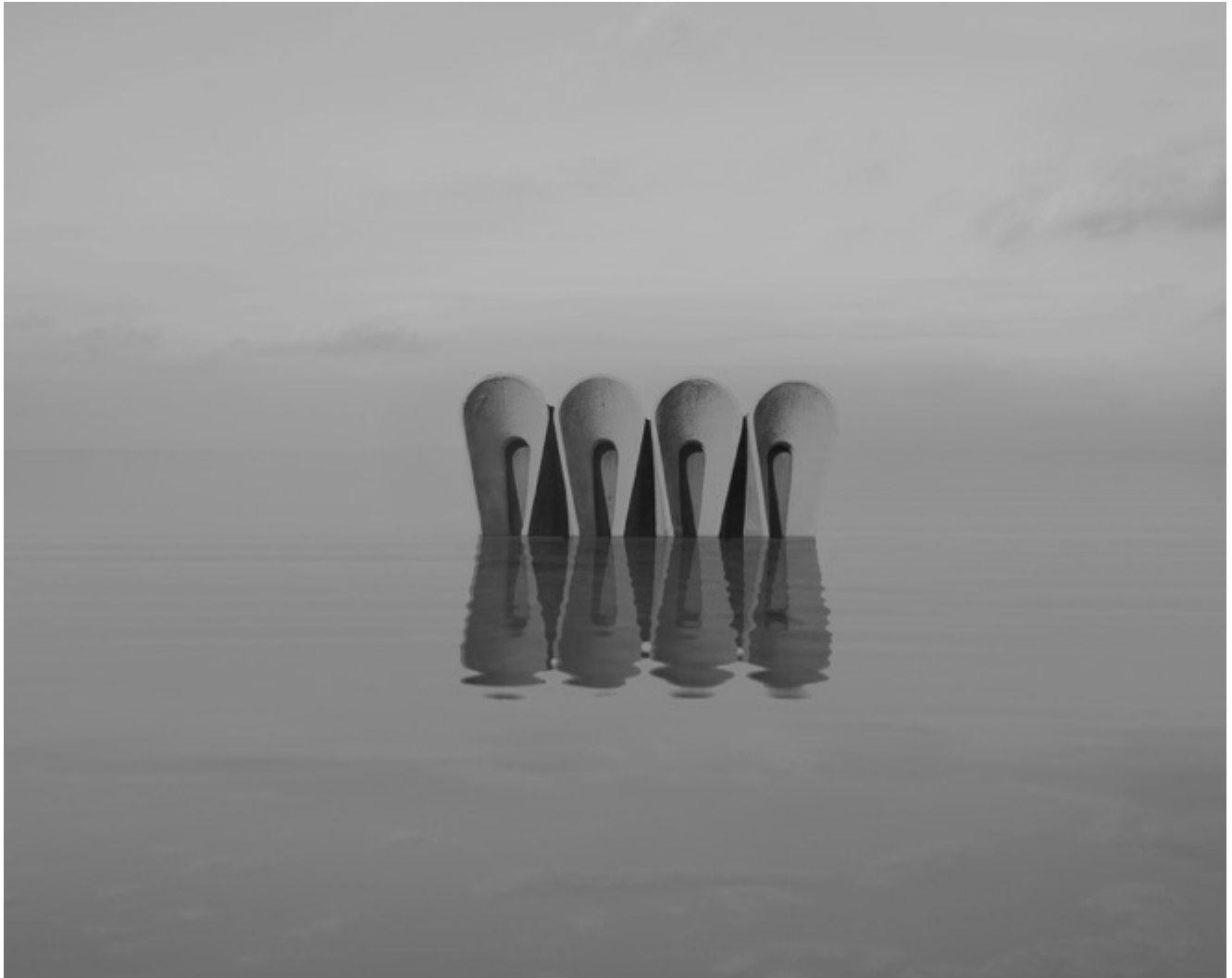
Danila TKACHENKO « Clôture, Arménie », 2021 2/12, 24x30 cm, tirage jet d'encre // 1200 euros