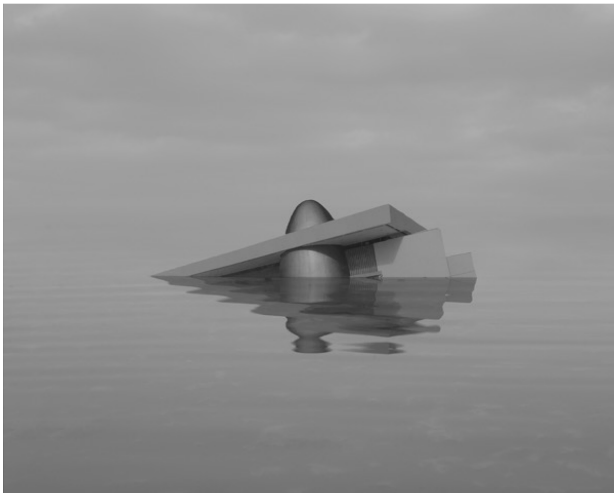
Danila TKACHENKO « Musée de l'astronautique, Russie », 2021 1/12, 24x30 cm, tirage jet d'encre // 1200 euros