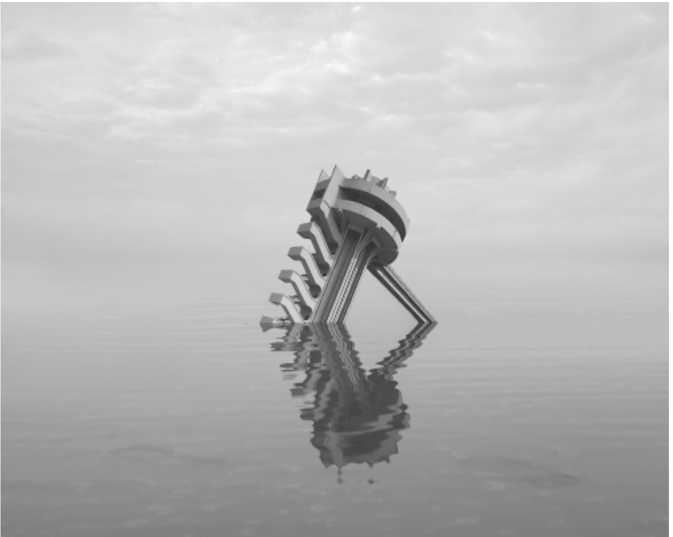
Danila TKACHENKO « Centre de loisirs "Dagomys", Russie », 2021 1/12, 24x30 cm, tirage jet d'encre // 1200 euros