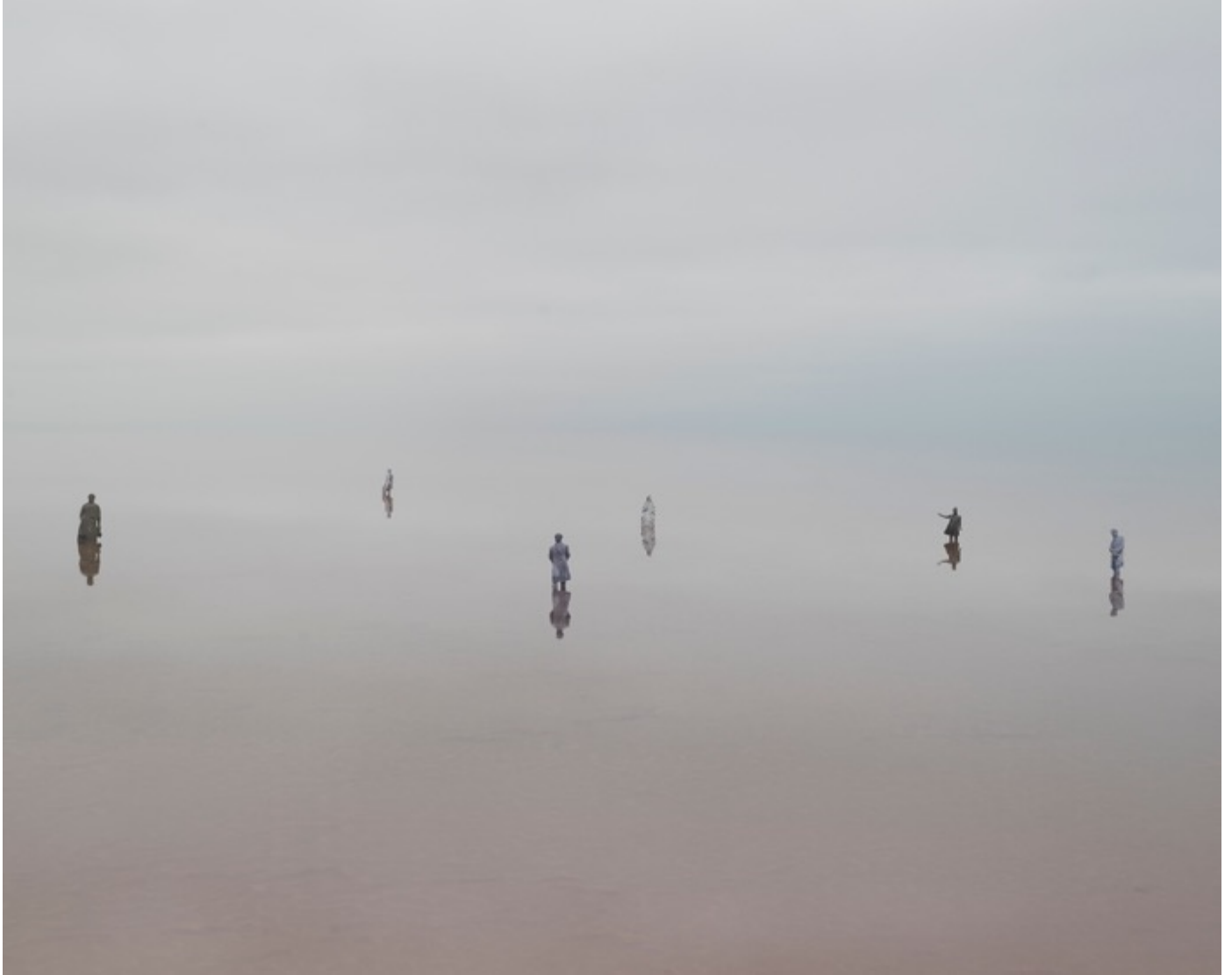
Danila TKACHENKO « Monuments à A.S. Pouchkine », 2021 2/10, 50x62,5 cm, tirage jet d'encre // 1800 euros