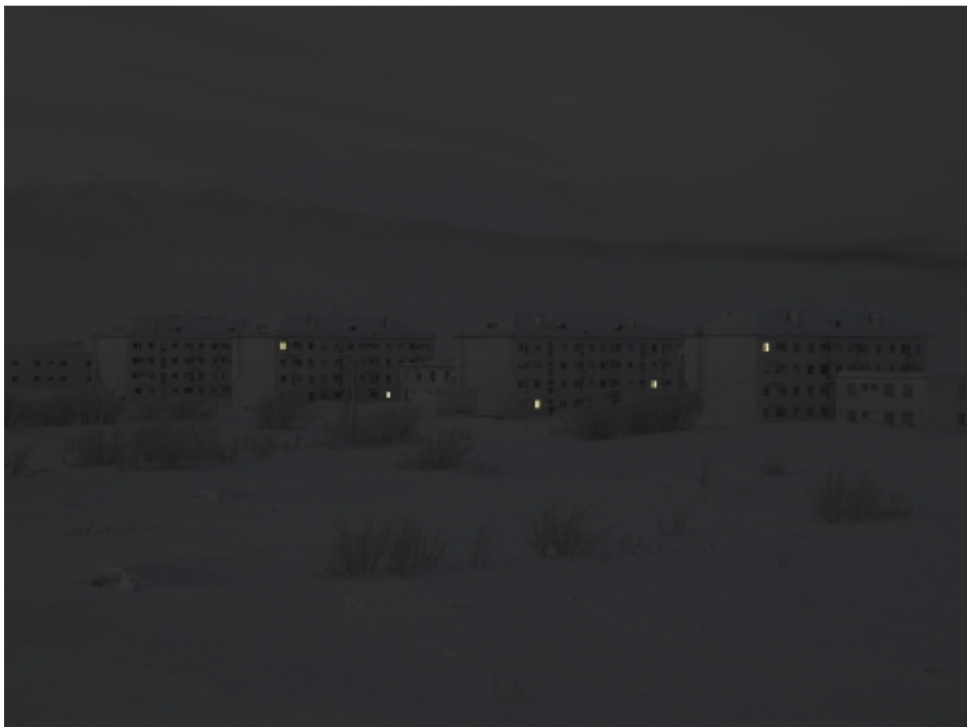
Danila TKACHENKO « Sans titre », 2020 2/7, 60x80 cm, tirage jet d'encre