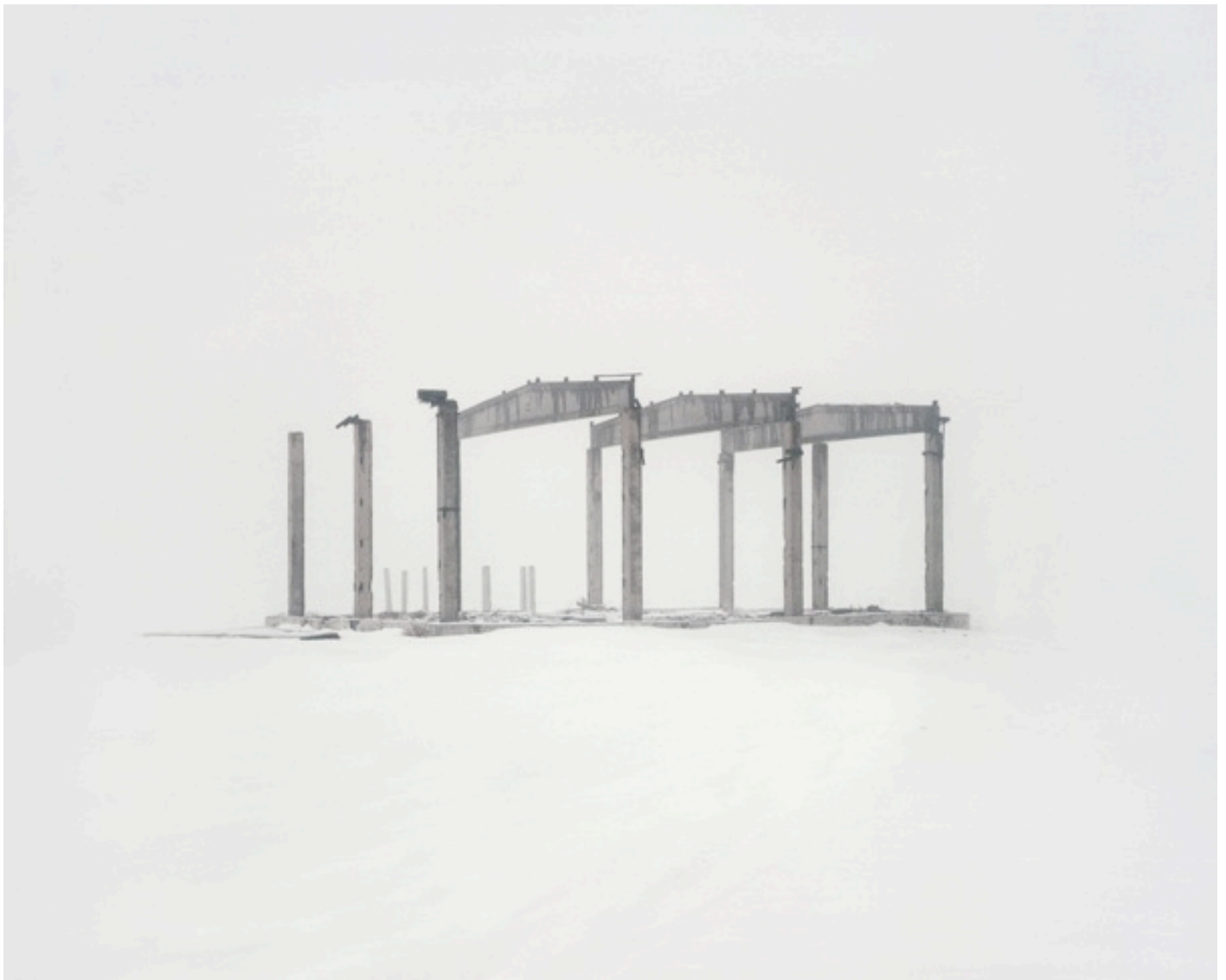
Danila TKACHENKO « Ruines d'un système laser expérimental ZET », 2011 2/6, 96x120, tirage jet d'encre // 4500 euros