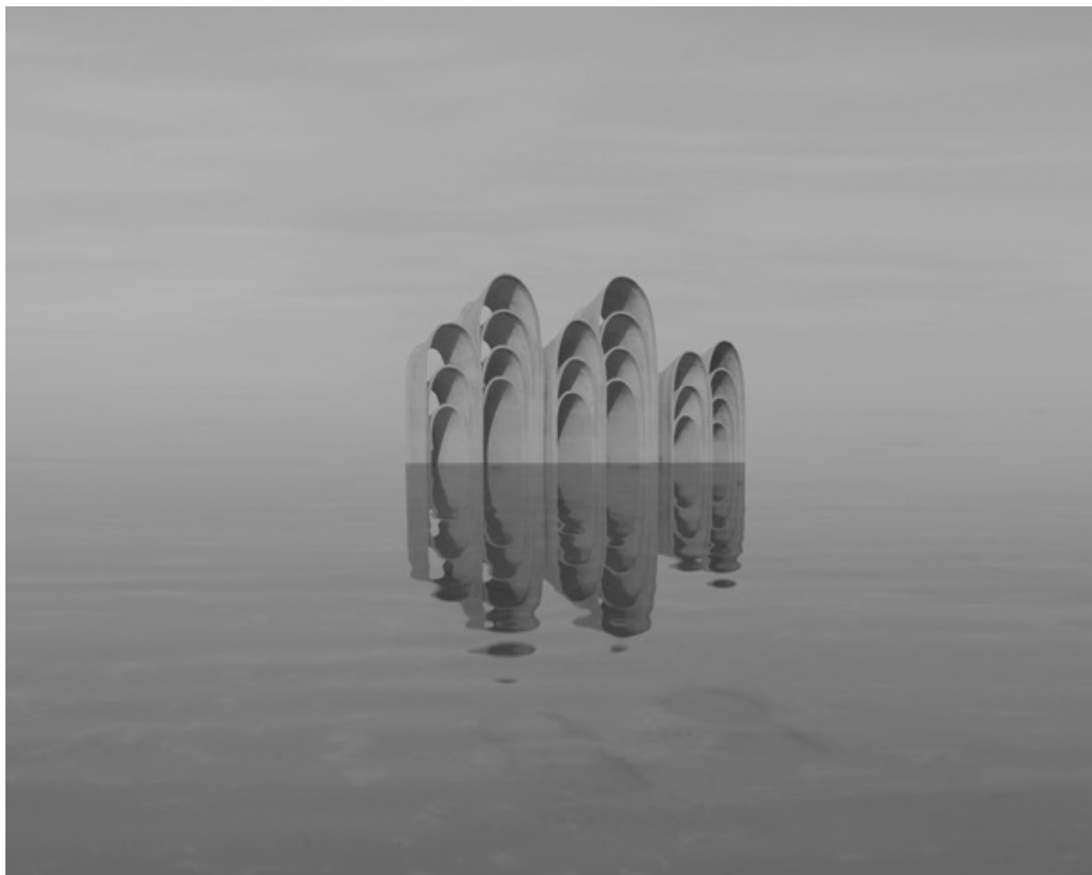
Danila TKACHENKO « Tribunes d'arcade spatiale, Géorgie », 2021 2/12, 24x30 cm, tirage jet d'encre // 1200 euros