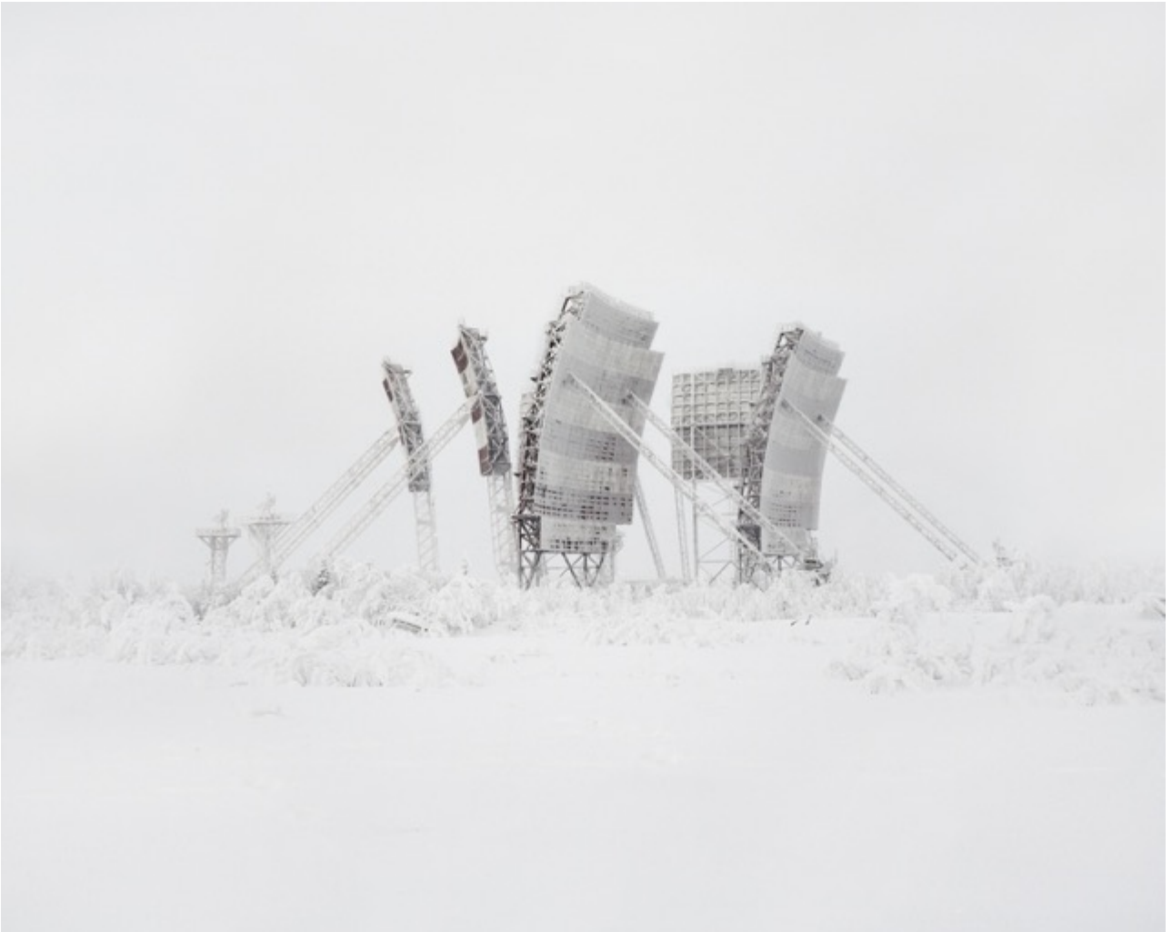
Danila TKACHENKO « Antennes troposphériques », 2013 6/12, 40 x 50 cm, tirage jet d'encre // 7000 euros