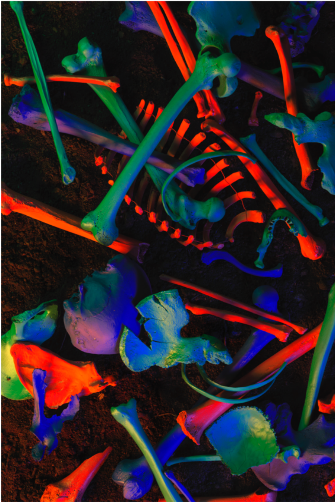
Danila TKACHENKO « Sans titre », 2019 3/7, 50x75 cm, tirage jet d'encre // 2500 euros