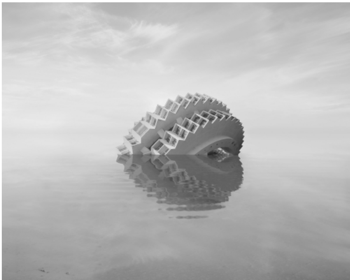
Danila TKACHENKO « Sanatorium "Amitié", Ukraine », 2021 2/7, 50x62,5 cm, tirage jet d'encre // 2500 euros