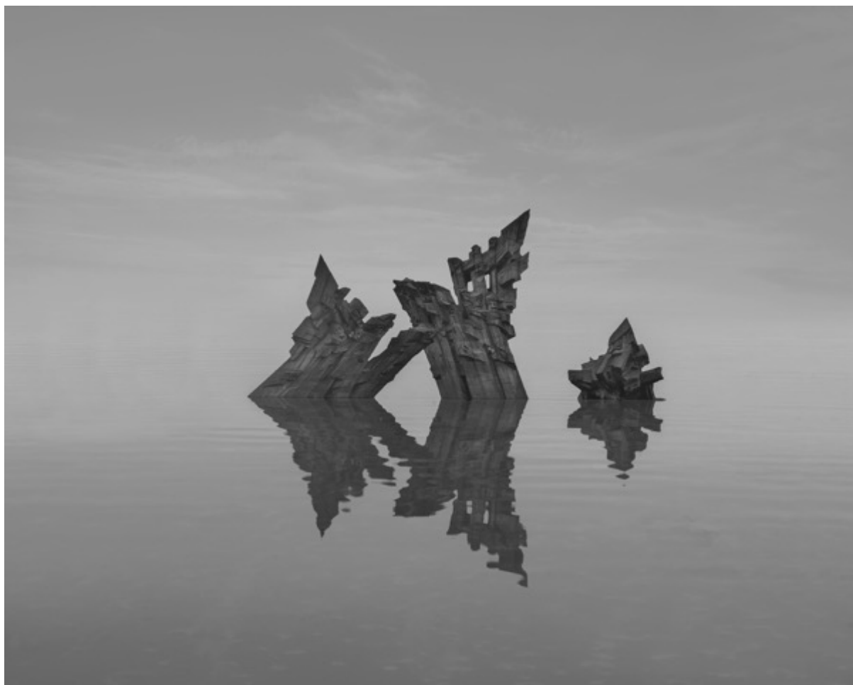
Danila TKACHENKO « Mémorial, Lituanie », 2021 2/12, 24x30 cm, tirage jet d'encre // 1200 euros