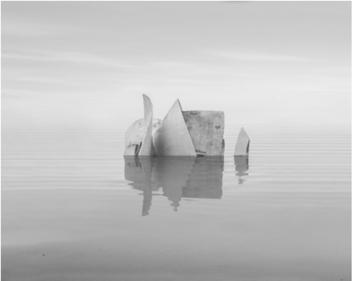
Danila TKACHENKO « Crematorium, Ukraine », 2021 2/12, 24x30 cm, tirage jet d'encre // 1200 euros